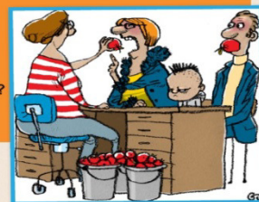
Figur 14. Forældresamtalen og UVP